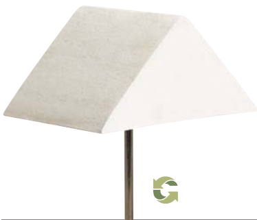
Púa de 4" (10 cm)