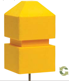
Púa de 4" (10 cm)