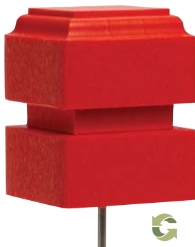
Púa de 4" (10 cm)