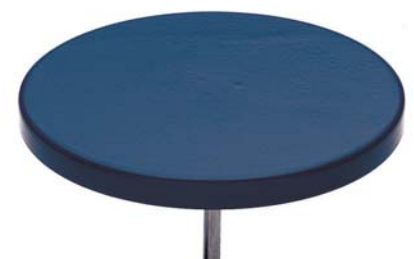
Púa de 5 1/2" (14 cm)